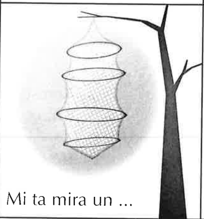
Mi ta mira un ...