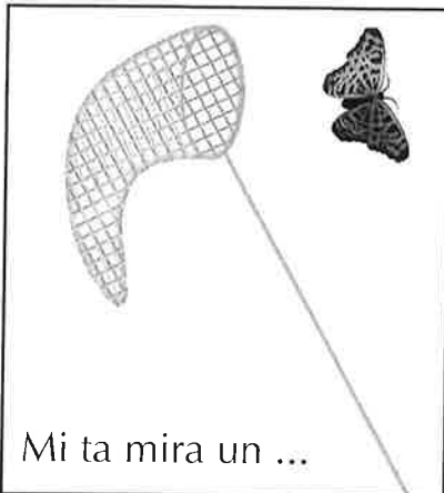
Mi ta mira un ...