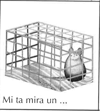
Mi ta mira un ...