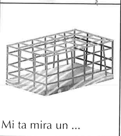
Mi ta mira un ...