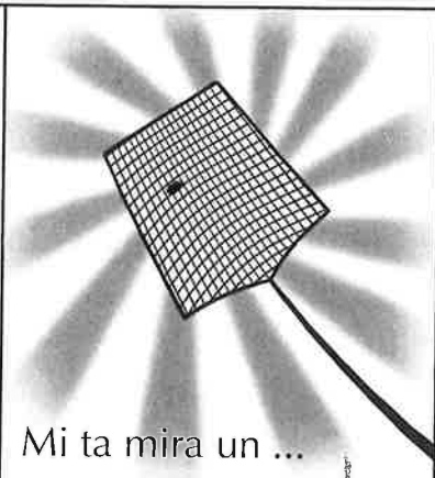
Mi ta mira un ...