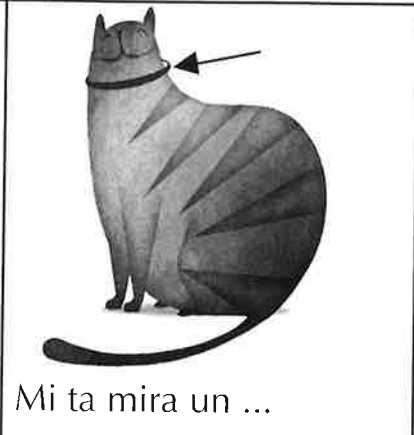
Mi ta mira un ...