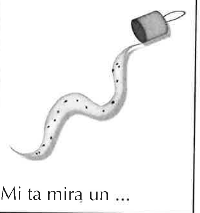
Mi ta mira un ...