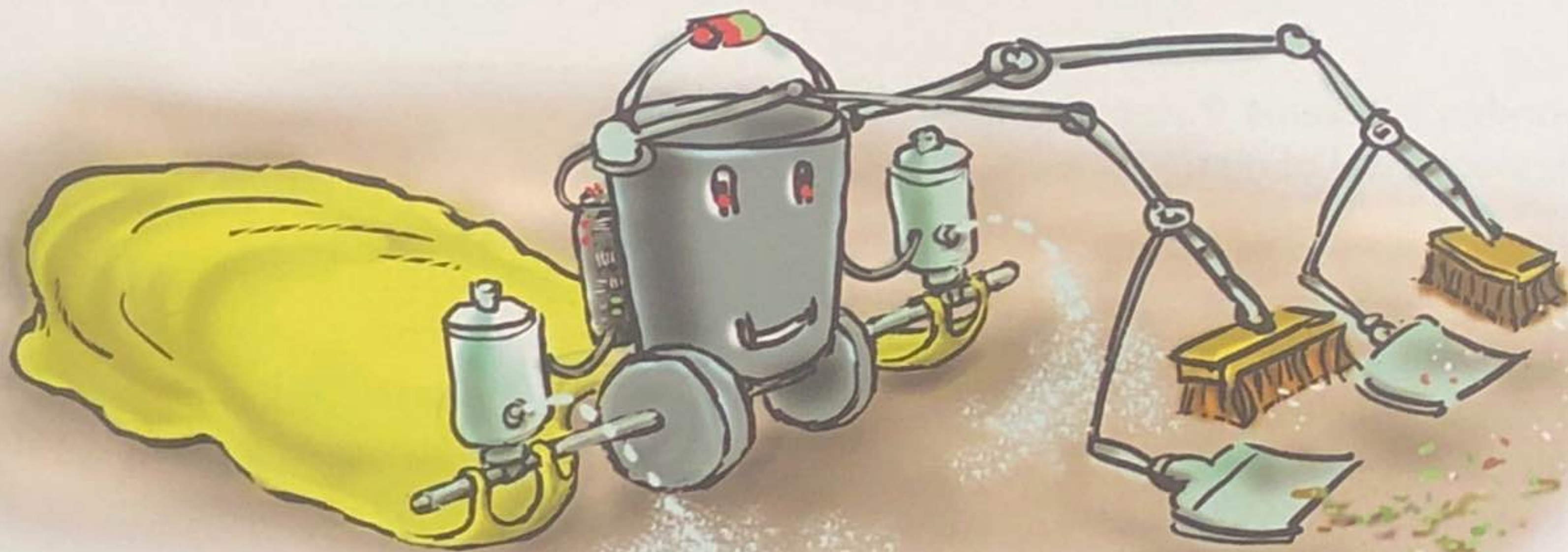
concept automatische kameropruimer

3 a Jij hebt het concept bedacht dat hieronder is afgebeeld. Beschrijf de toepasbaarheid van je uitvinding.