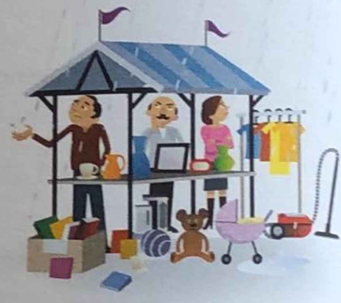
opbrengst 2 euro

b Schrijf op welke actie een mislukking is en welke actie een succes.