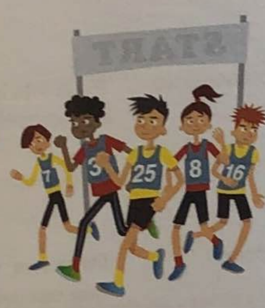
opbrengst 230 euro