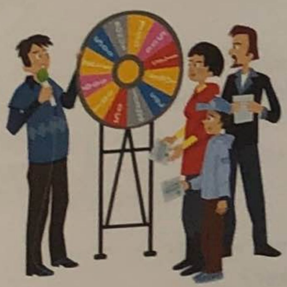
opbrengst 150 euro

2 a Schrijf het goede doel op. Kies uit: de rommelmarkt de sponsorloop de loterij