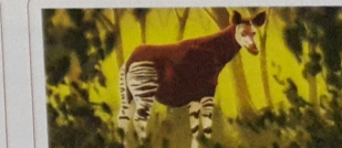
Ora un bestia ta ..., e ta skonde pa otro bestia i hende no mir'é.