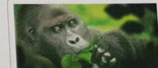
Gorila gusta ... manera fruta, blachi i kaska di palu.