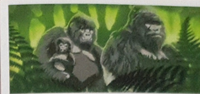
Gorila ta un bestia ... ku ta biba den grupo.