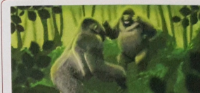
Solamente ora e topa ku un ... e bestia grandi akí ke mustra ken ta manda.