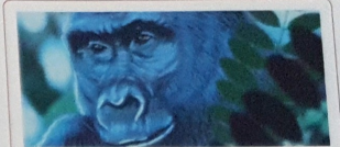
E makaku grandi akí ta un bestia pasífiko ku no ta ... fásilmente.