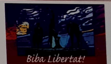
Danki Dios awor... ta prohibí tur kaminda na mundu.