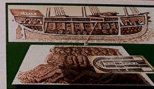
Den ... di e barku tabata stiwa i mara e katibunan.