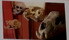
Den e di dos kasita nan ta mira ... di hende i bestia.