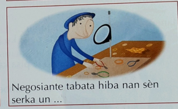
Negosiante tabata hiba nan sèn serka un ...