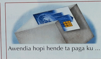
Awendia hopi hende ta paga ku ...