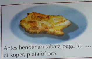
Antes hendenan tabata paga ku .... di koper, plata òf oro.