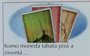
Komo moneda tabata pisá a inventá ...