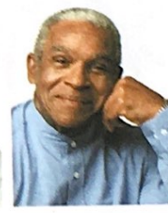
Rens 74 jaar