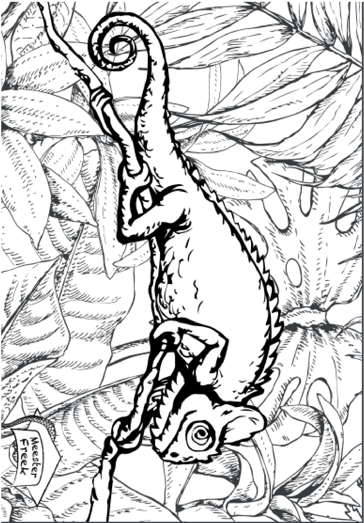
GEMAAKT DOOR CORINDA JANSEN