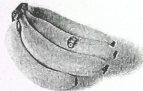
C. 759 gram