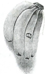
D. 0,76 kg.