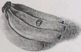
A. 734 gram