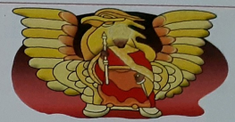
Tur hende tabata ... pa rikesa di e emperador di Timbuktu.