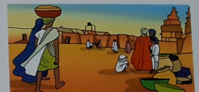
Hopi tempu pasá nan a ... Timbuktu. Esta nan a traha kas i otro edifisio.