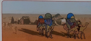
... ta hende ku no ta keda biba na un lugá.