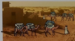
Karavana ku pasa Timbuktu, ta usa kamel i kabai komo ...