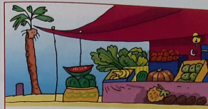
Pa fruta bo por bai un ...