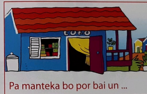
Pa manteka bo por bai un ...