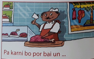
Pa karni bo por bai un ...