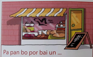
Pa pan bo por bai un ...

‘Wèl, Bea,’ mama ta bisa ku un sonrisa, ‘sòru pa e biaha akí bo no bai largu asina!’