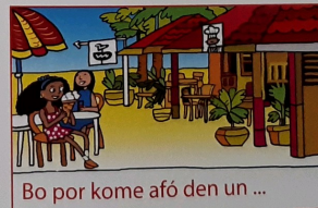
Bo por kome afó den un ...