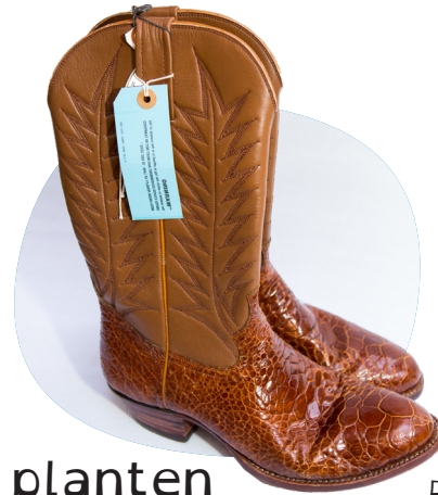
Deze laarzen zijn gemaakt van schildpaddenhuid!