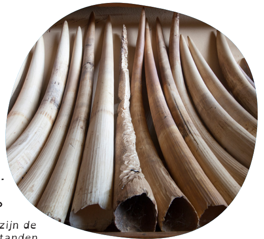
Dit zijn de slagtanden van olifanten.