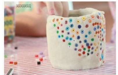
Pennenbakje van zoutdeeg en strijkkralen