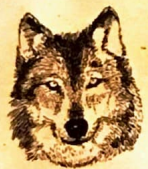
Stamboom van de Wolf