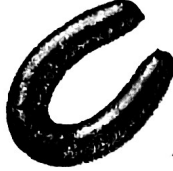
B. 0,486 kg