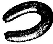
C. 0,519 kg