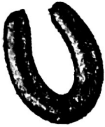
A. 0,459 kg