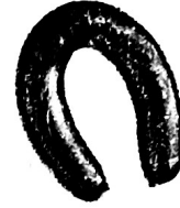
D. 0,491 kg